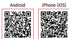
Электрон биллинг эришимли